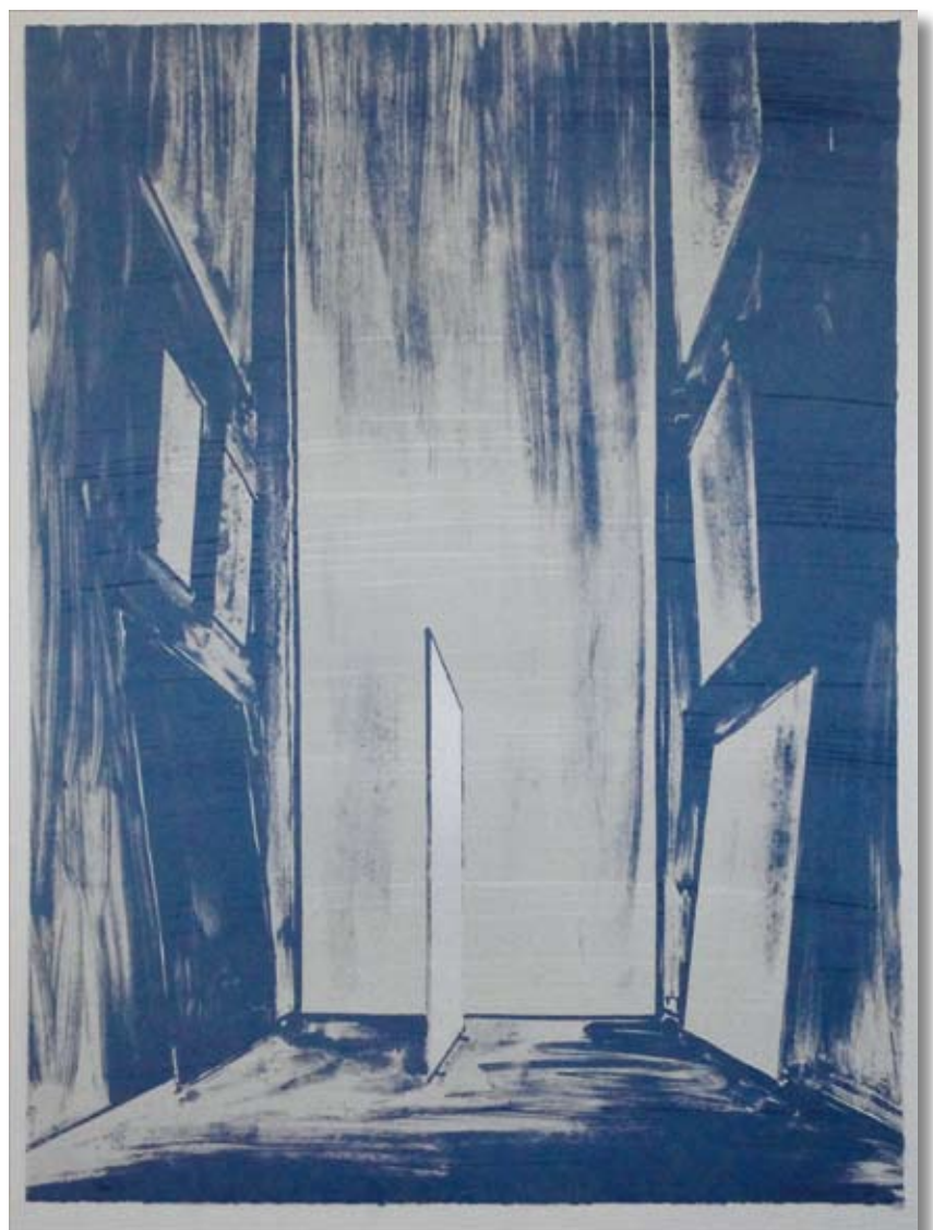
Jeroen Henneman, 'Atelier', zeefdruk, 100 x 80 cm., 1994

Het werk 'atelier' is eenvoudig en krachtig, op de lithosteen getekend in enkele rake lijnen. We zien een aantal schilderijen tegenover elkaar hangen en staan. In het midden staat een paneel rechtop in de ruimte. Het staat met één kant tegen een achterwand, hoewel dat ook de rand van een achterliggende ruimte kan zijn. Subtiel is de versmelting tussen het paneel en de achtergrond, daar waar de lijn van de rand van het paneel verdwijnt. Wat we zien is elegant, geheimzinnig, ogenschijnlijk simpel maar eigenlijk merkwaardig. Ook in dit werk roept Henneman met simpele lijnen en vormen vragen op over diepte, ruimte, licht en donker.